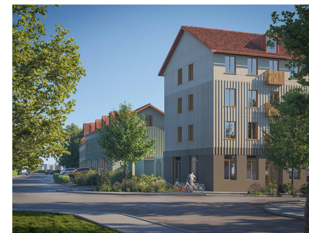
Planområdet mot Fjällbogatan och Frimästaregatan. Illustration: Okidoki arkitekter.