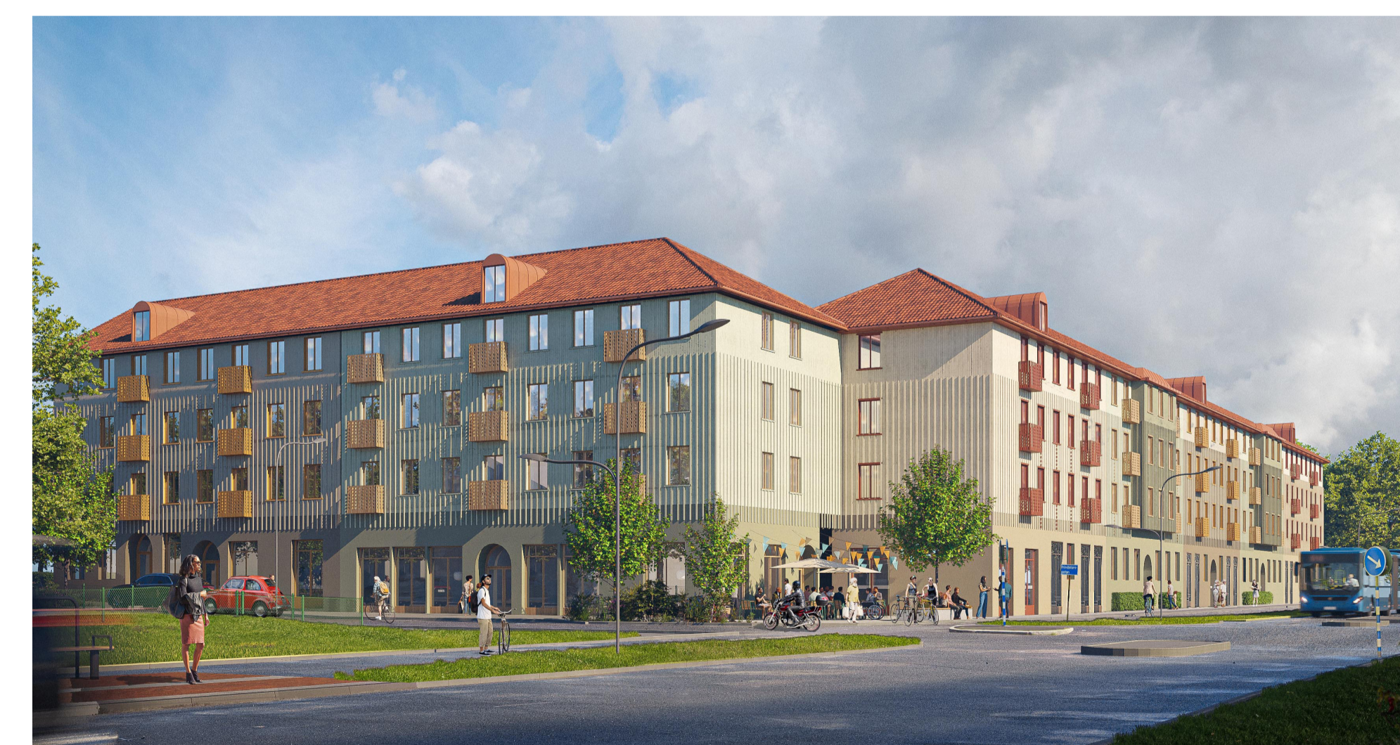
Planområdet mot Utbyvägen sett västerifrån. Illustration: Okidoki arkitekter.